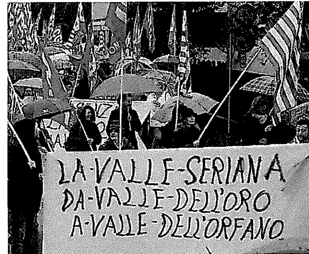
MANIFESTAZIONI Un corteo nel 2008 quando la crisi mordeva e si registravano chiusure di aziende o gesti disperati. A lato: il presidente della sezione fallimentare del Tribunale di Milano, Alida Paluchowski

za facile: «Ogni giorno, feste comprese, alla Sezione fallimentare del tribunale si rivolge un debitore in difficoltà - persona fisica (consumatore), professionista, lavoratore autonomo (partite Iva), artigiano e piccolo esercente o imprenditore - per ottenere la «composizione della crisi da sovraindebitamento», spiegava ieri la presidente della sezione fallimentare, Alida Paluchowski, alla presentazione, con il presidente dell'Ordine degli avvocati Remo Danovi, dell'Organismo di composizione delle crisi (Occ) appena istituito. Solo che al tribunale arrivano istanze incomplete: il debitore, incalzato da precetti e pignoramenti, conosce